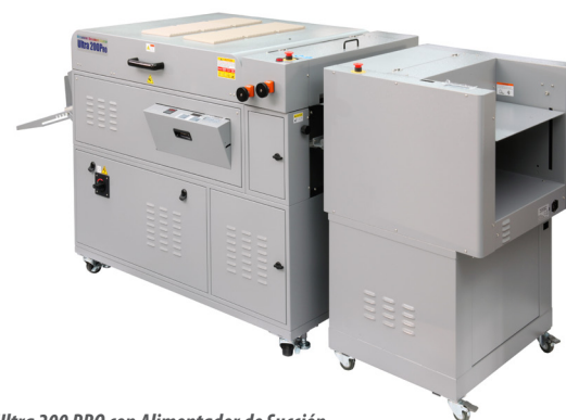
Ultra 200 PRO con Alimentador de Succión SF-300 (configuración estándar)