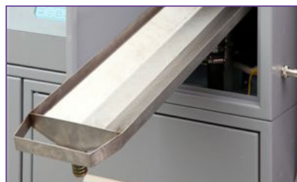
La bandeja de goteo de aceite UV es fácil de remover limpiamente