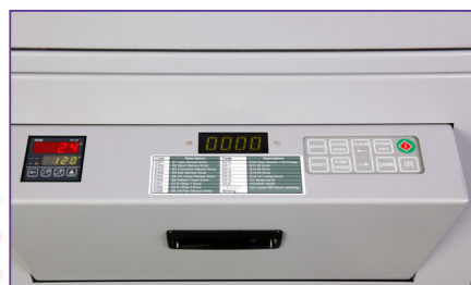
Sistema de Control Inteligente