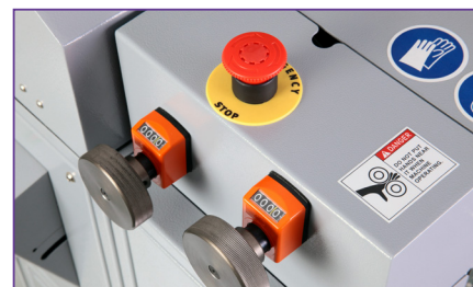
Las perillas permiten ajustar los rodillos de recubrimiento de manera fácil en incrementos de 0.1mm.