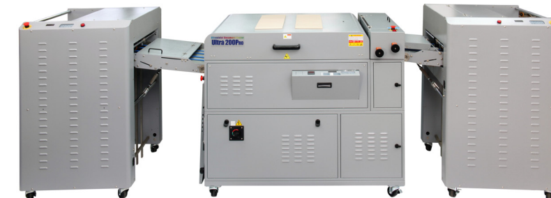
Ultra 200 PRO en línea con el Alimentador SF-300F y Apilador ST-300 de Alta Capacidad opcional